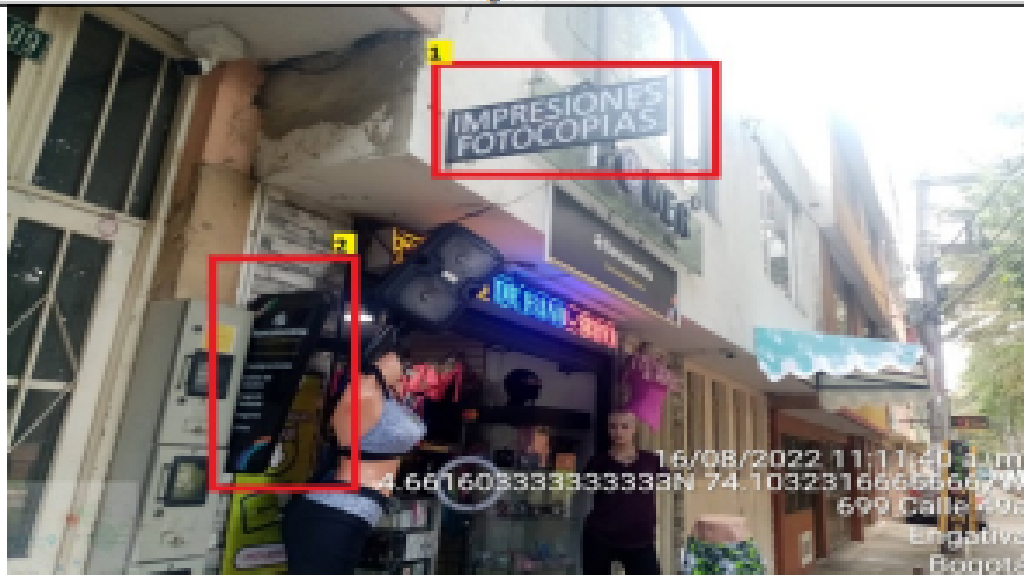
Fotografía No. 5

En la cual se evidencian dos (2) elementos PEV, pertenecientes al establecimiento comercial denominado CONFECCIÓN WIDEC, los cuales se encuentran volados de la fachada y son adicionales al único elemento permitido por fachada de establecimiento comercial.